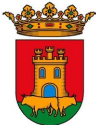
Ayuntamiento de Talavera de la Reina